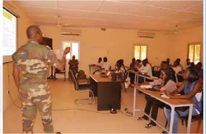
Étudiants de l'UFR/santé de l'Université de Thiès Formation à la culture citoyenne

La formation d'une jeunesse citoyenne, responsable et dévouée au service de sa communauté, respectueuse des biens publics et des symboles de la république, est une œuvre continue et inlassable qui engage la responsabilité collective. Elle passe nécessairement par « l'éducation qui permet à l'homme de nier son animalité et, ce faisant, de se socialiser; elle lui permet de passer de l'être individuel et égoïste à l'être social, de l'être animal et immoral à l'être moral » 3 . C'est pourquoi, la préoccupation principale des éducateurs est d'enseigner aux jeunes les vertus de ces valeurs ainsi que de leur utilité dans l'organisation de la société.