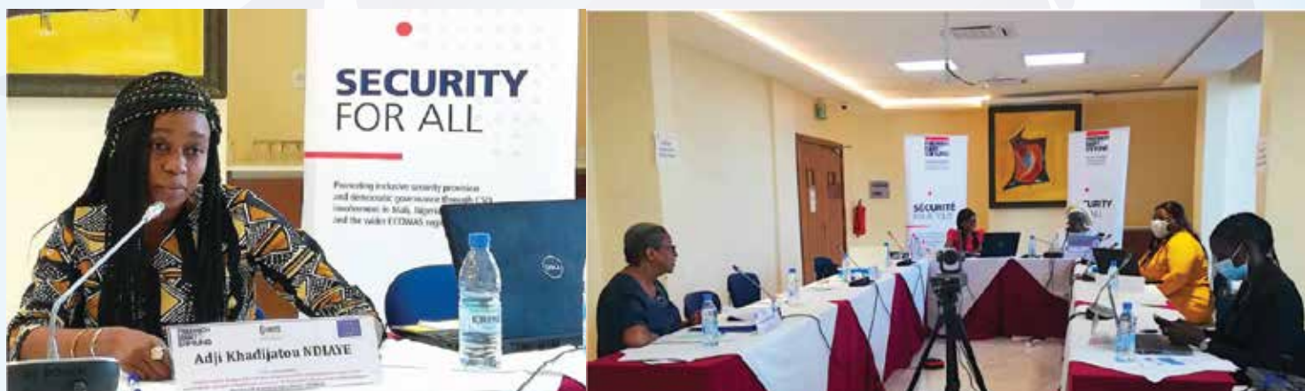
Atelier national de renforcement des capacités pour les professionnels des médias au Mali, du 02 au 04 novembre 2021 à Bamako, en duplex avec Dakar.

Les experts des médias ont pu échanger sur les concepts clés, contextualiser l'environnement sécuritaire et partager sur les éléments techniques et bonnes pratiques de recherche et d'investigation.