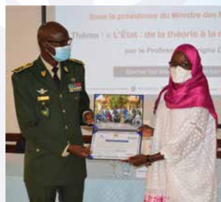
Remise des diplômes de la promotion 2021 par le CEMGA

Le Professeur Serigne DIOP ancien ministre et ancien Médiateur de la République a livré le Cours inaugural, sous le thème « l'Etat : de la théorie à la réalité au Sahel » marquant le démarrage officiel de la formation de la septième promotion. Le Professeur estime que nous devons adopter une approche téléologique de l'Etat. Il considère également que l'Etat doit être perçu à travers la poursuite de fins ou de buts. La légitimité de l'Etat est intimement corrélée à ses capacités externes et internes à assurer la sécurité des personnes et des biens, mais surtout par ses moyens à assurer le bien-être de la population.