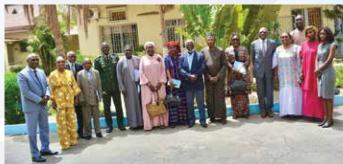
Généraux en activité et Cadres de réserve ayant pris part à l'activité

Dans le cadre des préparatifs de l'organisation de la 7 ème édition du Forum international de Dakar sur la Paix et la Sécurité en Afrique (FDD), la deuxième réunion du Comité des Personnes ressources de la Commission scientifique s'est tenue au Centre des Hautes Études de Défense et de Sécurité (CHEDS), le mardi 15 juin 2021, à partir de 10 heures.