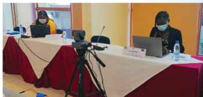
Troisième et dernier d'une série d'ateliers