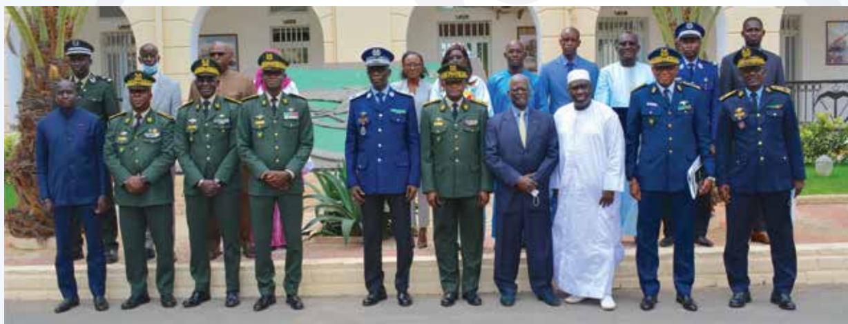
Photo de groupe des auditeurs de la promotion sortante - session 2020/2021

Disposer d'un service public qui répond aux besoins des populations sur l'ensemble du territoire est la marque d'un Etat utile aux hommes et aux femmes d'un pays.