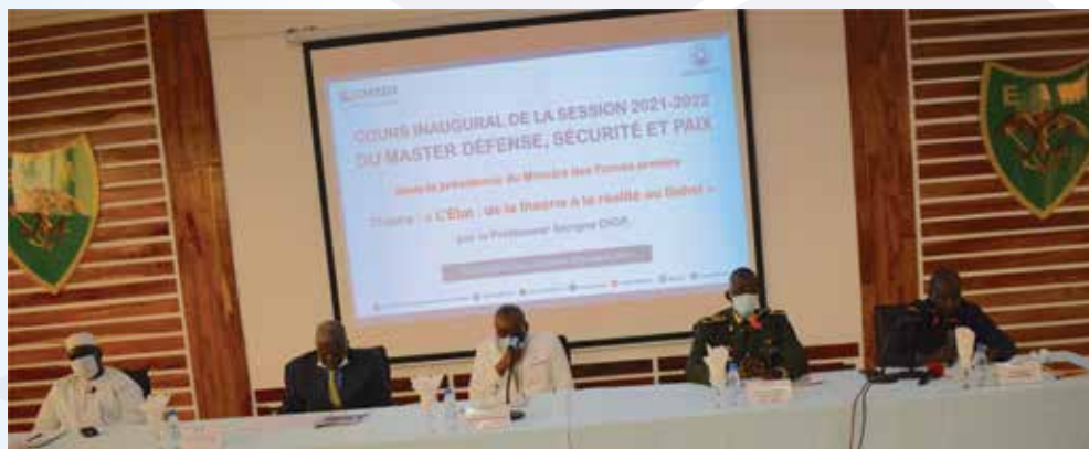
cours inaugural de la session 2021-2022 du Master Défense Sécurité

À cet occasion, le Ministre des Forces Armées a souligné que la sécurité est devenue une préoccupation majeure dans le Sahel compte tenu des risques sécuritaires et des menaces complexes. Les « dynamiques de résilience qui doivent aller au-delà du cadre des actions militaires requièrent des ressources humaines de qualité préparées aux nouveaux défis ». La formation du Master Défense, Sécurité et Paix répond au besoin de capacitation des cadres civils et des Forces de Défense et de Sécurité, par le renforcement des connaissances fondamentales de l'environnement géostratégique ainsi que des enjeux liés à la défense, la sécurité et la paix. Au cours de cette cérémonie, les auditeurs de la promotion 2020 ont reçu leurs diplômes.