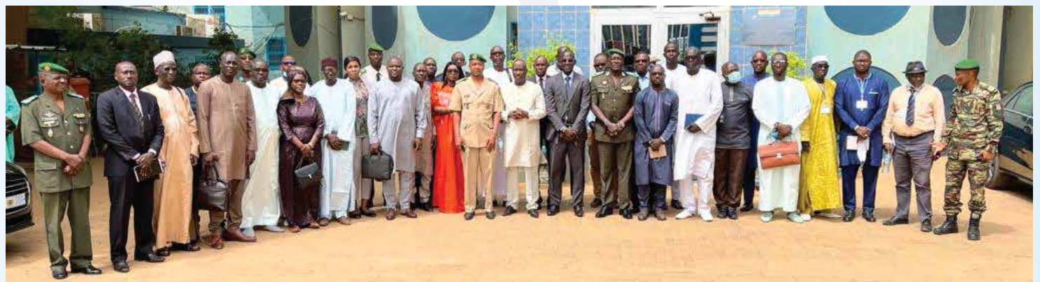
Haut Commandement de la Gendarmerie Nationale et la Garde Nationale du Niger - NIAMEY

Le voyage d'étude des sessions 2020 et 2021 du Master Sécurité nationale, organisé dans la période du 06 au 10 juillet 2021 à Niamey, au Niger, s'est déroulé dans de bonnes conditions. La délégation a visité les principales structures chargées de la gestion de la sécurité, notamment l'Etat-Major des Armées du Niger, la Direction générale de la Police nationale et le Service central de lutte contre le terrorisme et la criminalité transfrontalière (SCLCT/CTO), le Haut Commandement de la Gendarmerie nationale et la Garde nationale, la Direction générale de la protection civile et l'Ecole nationale de la protection civile, le Centre national des Etudes stratégiques et sécuritaires (CNESS) et la Haute Autorité à la Consolidation de la Paix (HACP) au Niger.