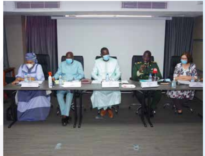
Jour 1 du Séminaire de lancement

L'enjeu de ce séminaire est de faire un état des lieux de la connaissance sur les causes de l'insécurité, sur le rôle et les missions des différents acteurs et sur un modèle de gouvernance locale des questions de sécurité adossé à des outils pratiques.