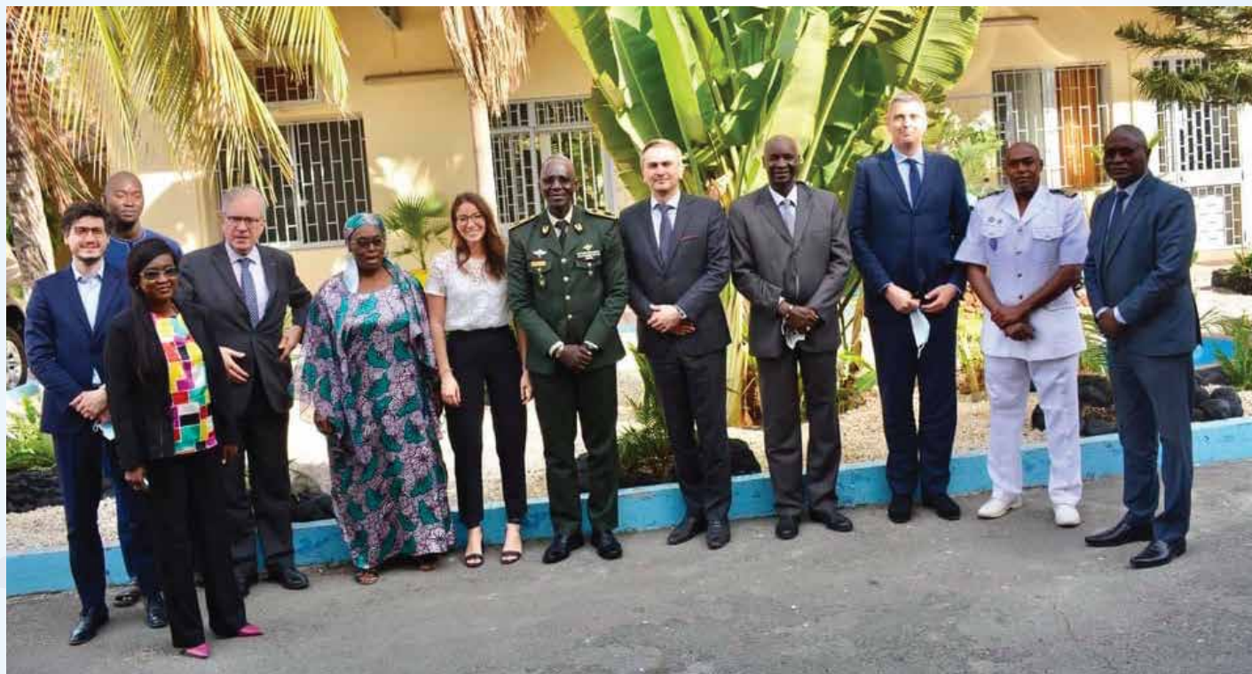
Photo de groupe avec la délégation

La visite a été marquée par un entretien en tête à tête entre le Directeur général du CHEDS et le chef de la délégation d'AVISTA Partners et une séance de travail bilatérale des deux délégations dans la Salle de conférence n°1.