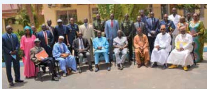
Généraux en activité et Cadres de réserve ayant pris part à l'activité

La 2 ème session de l'année 2021 du Forum Défense et Sécurité s'est tenue au Centre des Hautes Études de Défense et de Sécurité (CHEDS), le mercredi 30 juin, de 10h00 à 12h30, sur le thème "Enjeux, défis actuels et perspectives du processus de paix en Casamance".