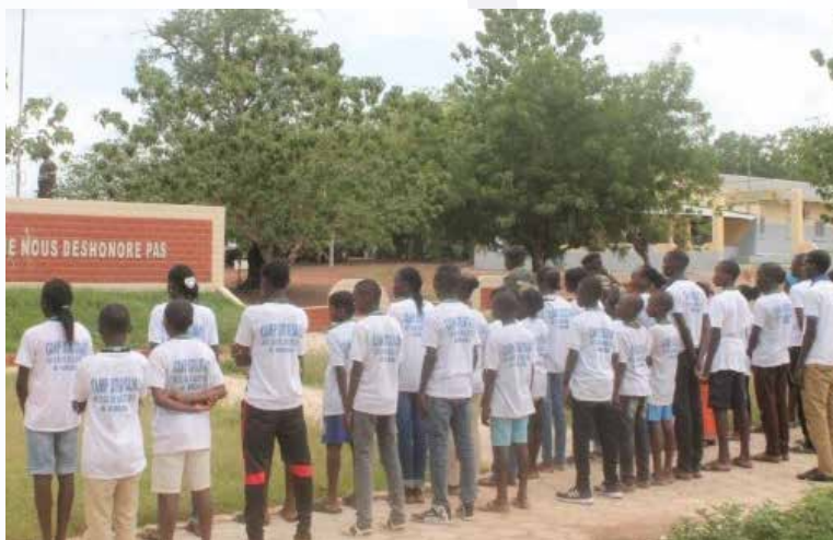
Education à la citoyenneté/Ecole du drapeau à de jeunes élèves

En définitive, la citoyenneté fournit donc une identité collective alimentée par une histoire commune, l'usage d'une ou plusieurs langues, la référence au même substrat socioculturel, la soumission aux mêmes lois, des valeurs partagées, comme les symboles (drapeau, devise, armoiries, sceaux, hymne national).