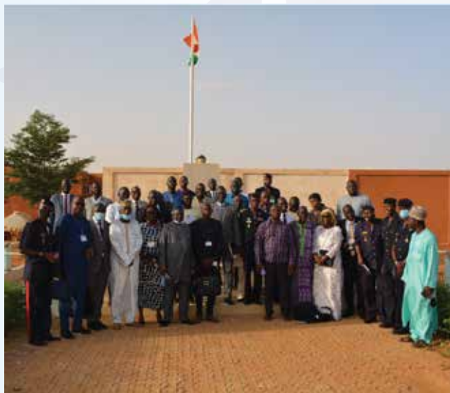
Direction de la Protection Civile du Niger - NIAMEY

Le voyage d'étude des sessions 2020 et 2021 du Master Sécurité nationale, organisé dans la période du 06 au 10 juillet 2021 à Niamey, au Niger, s'est déroulé dans de bonnes conditions. La délégation a visité les principales structures chargées de la gestion de la sécurité, notamment l'Etat-Major des Armées du Niger, la Direction générale de la Police nationale et le Service central de lutte contre le terrorisme et la criminalité transfrontalière (SCLCT/CTO), le Haut Commandement de la Gendarmerie nationale et la Garde nationale, la Direction générale de la protection civile et l'Ecole nationale de la protection civile, le Centre national des Etudes stratégiques et sécuritaires (CNESS) et la Haute Autorité à la Consolidation de la Paix (HACP) au Niger.