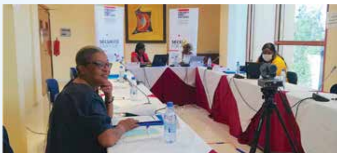
Troisième et dernier d'une série d'ateliers

Il sied de rappeler que cet atelier entre dans le cadre du projet de l'Union européenne « Sécurité pour tous », cofinancé et mis en œuvre par la Friedrich Ebert Stiftung Paix et Sécurité Centre de Compétence Afrique Subsaharienne (FES-PSCC), en partenariat avec le Centre des Hautes Etudes de Défense et de Sécurité (CHEDS). Il fait suite au séminaire régional de formation des formateurs en multiplex qui s'est déroulé du 25 au 27 mai 2021 ciblant les médias du Cameroun, du Mali et du Nigéria.